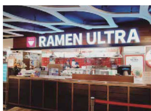
【2022年オープン】 台北市士林區忠 大葉高島屋店