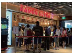
【2019年オープン】 台北市南港 GLOBAL MALL 南港車站店