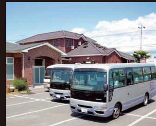
団体様用「送迎バス」