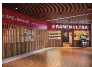
【2015年オープン】 高鉄 桃園駅前 台湾グロリア・アウトレット