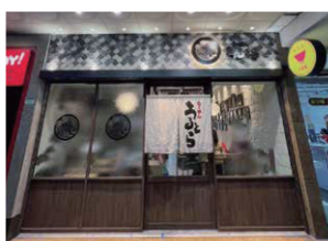
【2024年オープン】 台北市中山區林森 林森店