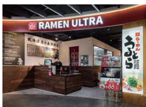
【2018年オープン】 台湾桃園空港MRT(鉄道) A8長庚病院駅ビル Global mall