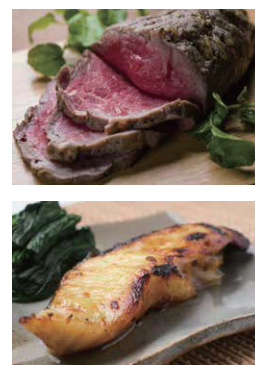
写真はすべてイメージです。