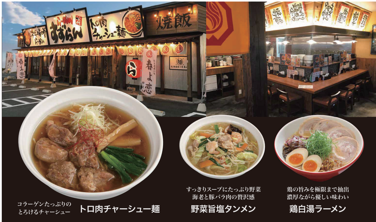
コラーゲンたっぷりの とろけるチャーシュー

安全で安心な当店のメニューは、「春よ恋」など美味しい北海道産小麦100%を使用した特製麺が自慢。 すっきりとしながら味わい深い清湯スープと、鶏の旨味を極限まで炊き出した鶏白湯スープのお店です。 台湾では「RAMEN ULTRA」6店舗が好評営業中。